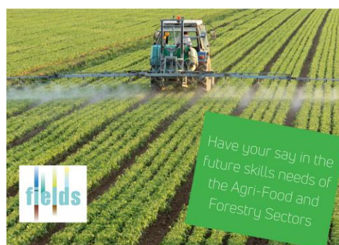
Slika 2. Slike za uporabo v družbenih medijih in spletnih platformah za promocijo raziskave