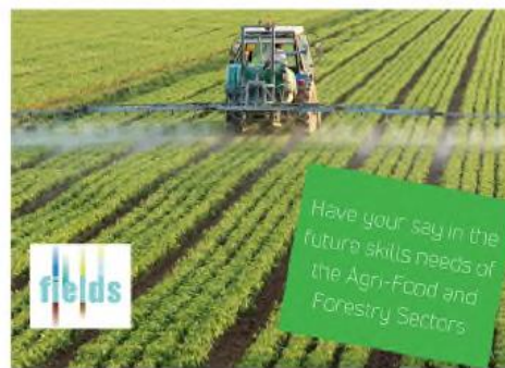
Abbildung 2. Bilder für die Verwendung in sozialen Medien und webbasierten Plattformen zur Bewerbung der Umfrage